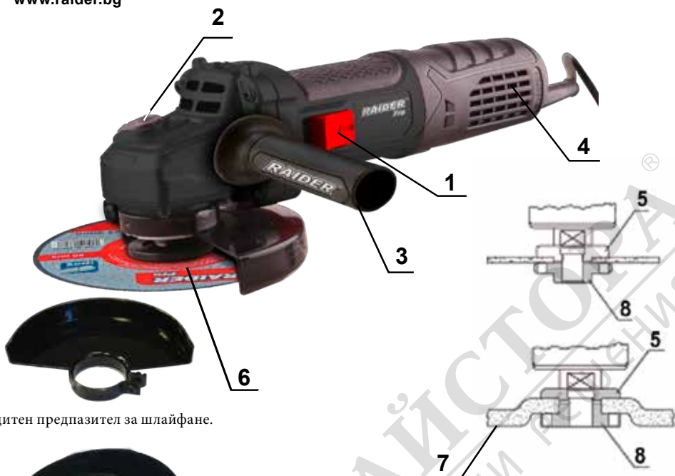
Защитен предпазител за шлайфане.