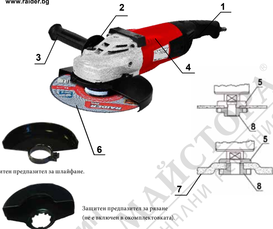
Защитен предпазител за шлайфане.