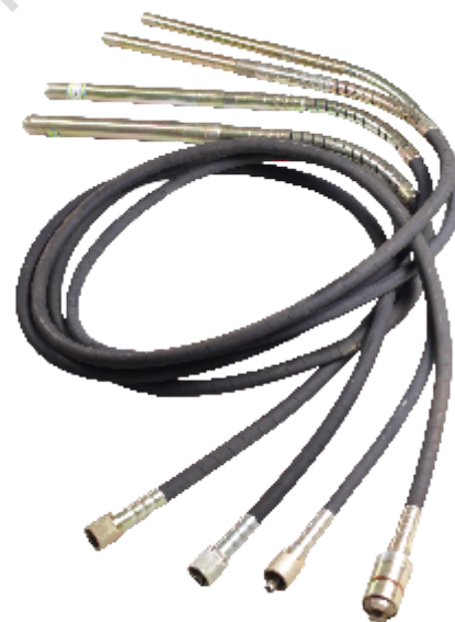
Lance pentru vibrare