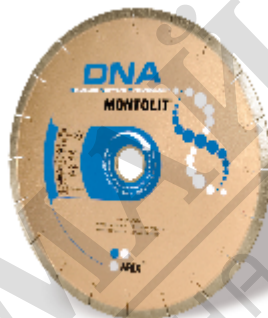
Disc diamantat SCX250 inclus