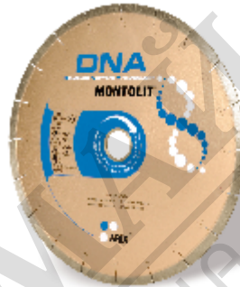
Disc diamantat SCX250 inclus