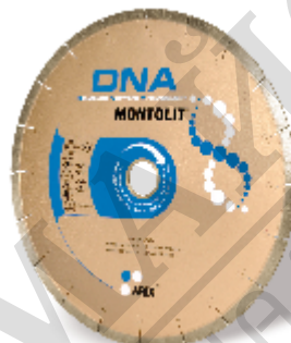
Disc diamantat SCX250 inclus