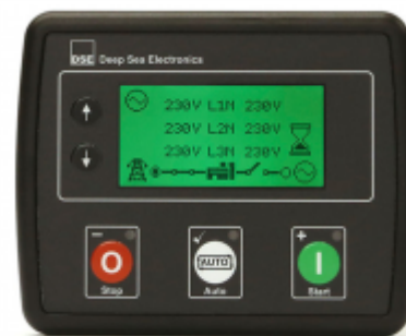
Panou comanda tip QT2A-4520

Protectie IP 65 Temperatura de lucru -30° + 70°C