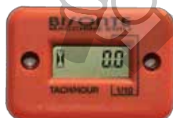
Contor ore ce afiseaza durata de utilizare si turatia motorului