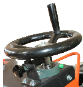
Pin blocare adancime taiere