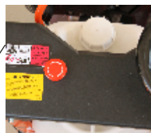
Buton oprire de urgenta