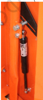
Cilindru cu gaz pentru o coborare / ridicare mai usoara a discului