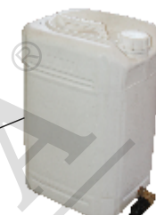
Bidon de apa 35l ce poate fi demontat pentru a-l realimenta