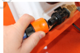
Conector rapid la bidonul de apa