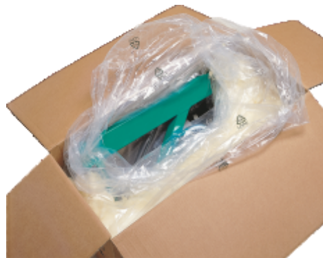
Mod ambalare si transport