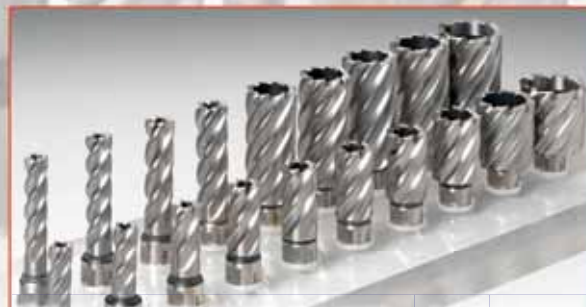
Präsentationsstand / Display stand