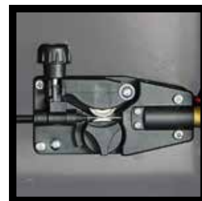
TRAINAFILO ROBUSTO D. 25 ROBUST WIRE FEEDER D. 25