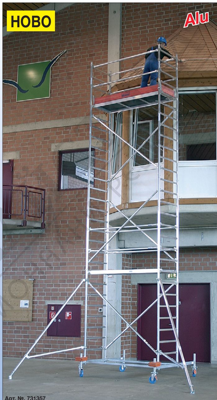
Арт. №. 731357

Частите от системата ще намерите след страница 84.