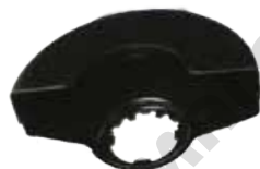
Защитен предпазител за рязане (не е включен в окомплектовката).