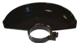
Защитен предпазител за шлайфане.