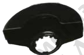
Защитен предпазител за рязане (не е включен в окомплектовката).