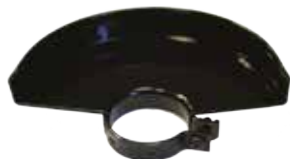
Защитен предпазител за шлайфане.