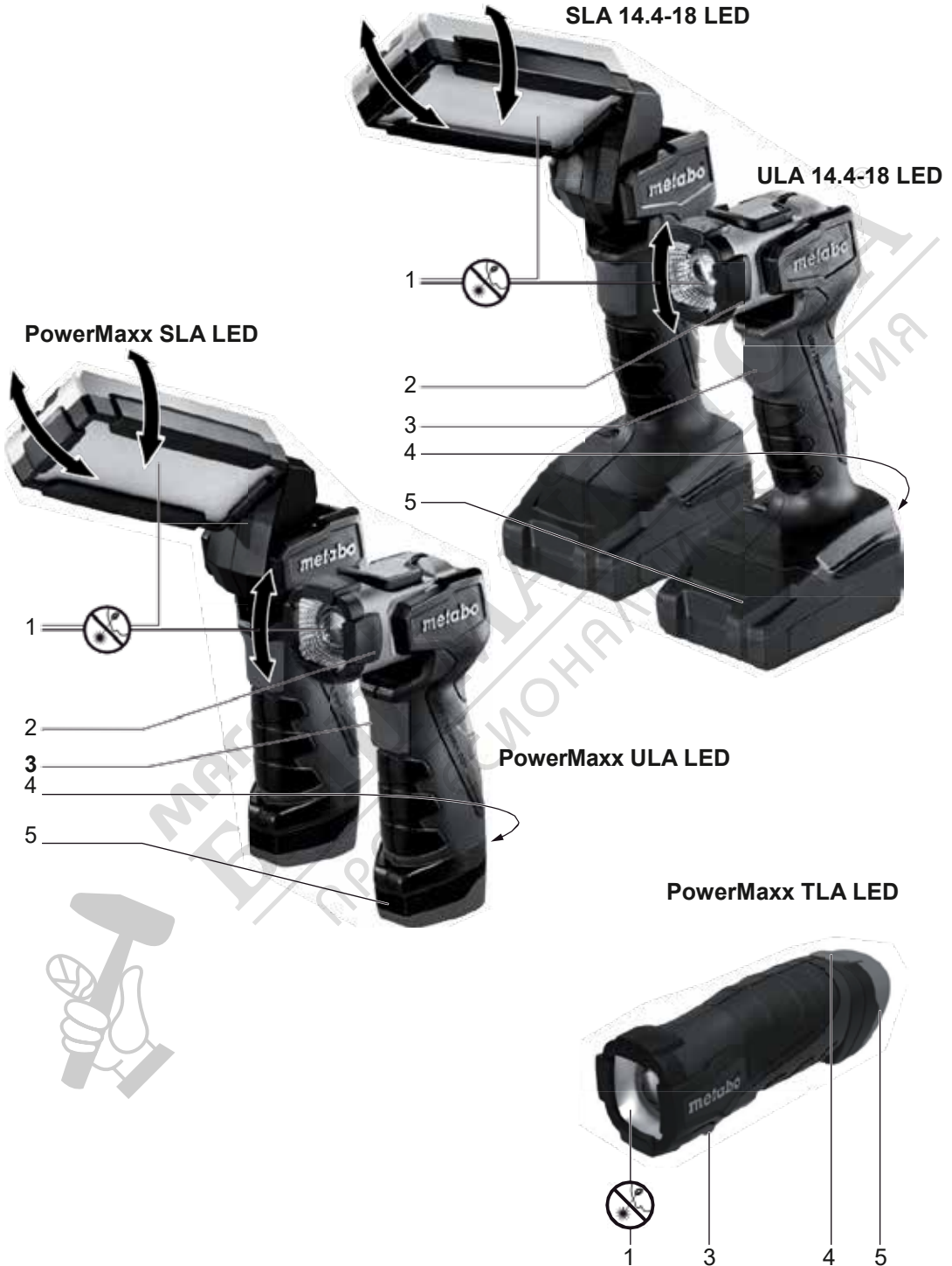
PowerMaxx TLA LED