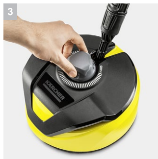
3 Регулиране на височината