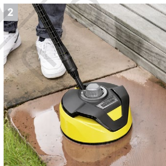
2 Защита срещу пръскане