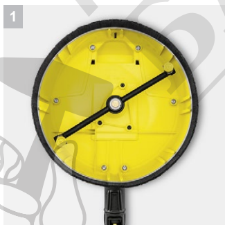
1 Две ротиращи плоски струйни дюзи

Обстойно и без пръски почистване на големи площи: Т 5 T-Racer приспособление за почистване. Регулирането на дюзите означава, че устройството може да се използва за почистване на твърди и деликатни повърхности.