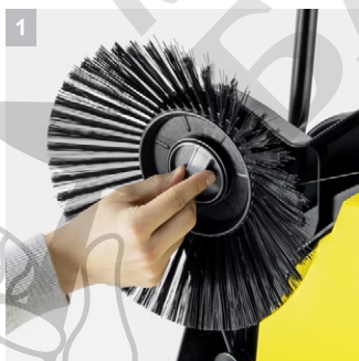
1 Практична капачка за странична четка

Идеална за целогодишно приложение на по-големи и по-широки площи и почиства старателно до ръба: S 6 Twin машина с 2 странични четки, 38 л контейнер за отпадъци и работна ширина 860 мм.