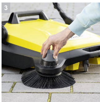
3 Регулиране на височината на страничните четки