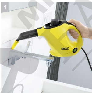
1 Мощен поток на парата - 3 бара

ДЪЛГОКО ПОЧИСТВАНЕ БЕЗ ХИМИКАЛИ УНИЩОЖАВА ДО 99.999% ОТ КОРОНАВИРУС* И БАКТЕРИИ**