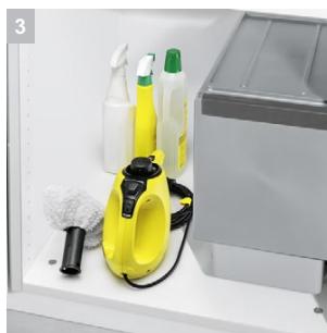
3 Малък, удобен и лесен за съхранение уред

Уредът заема малко място и може да се съхранява на мястото, на което се използва.