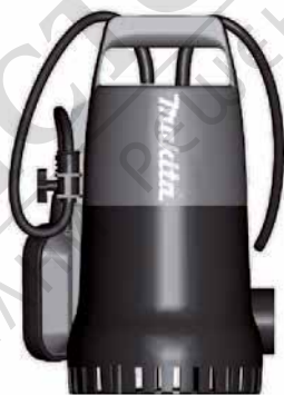
PF 0300 - PF 0800