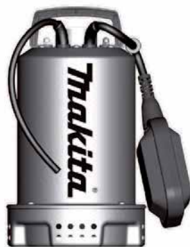
PF 0403 - PF 1100