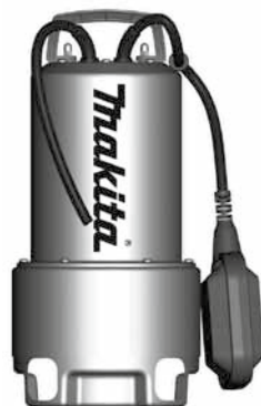
PF 0610 - PF 1110