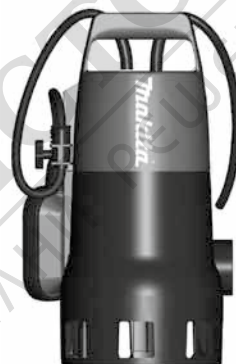
PF 0410 - PF 1010