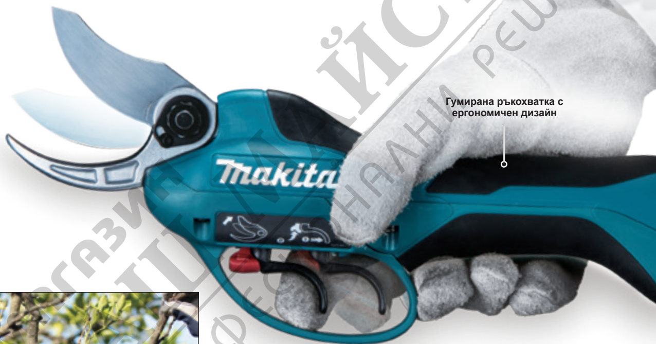
Гумирана ръкохватка с ергономичен дизайн