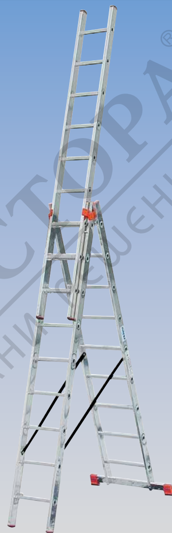
Арт. №. 120601