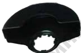
Защитен предпазител за рязане (не е включен в окомплектовката).