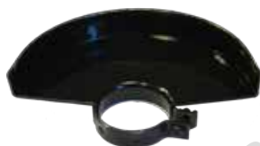
Защитен предпазител за шлайфане.